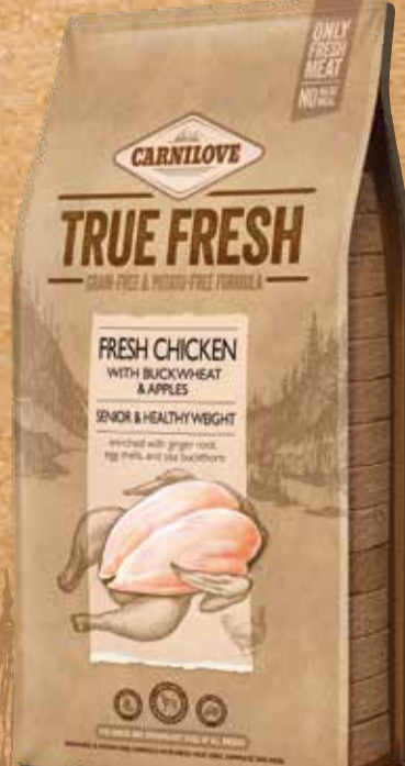
סניור עוף טרי