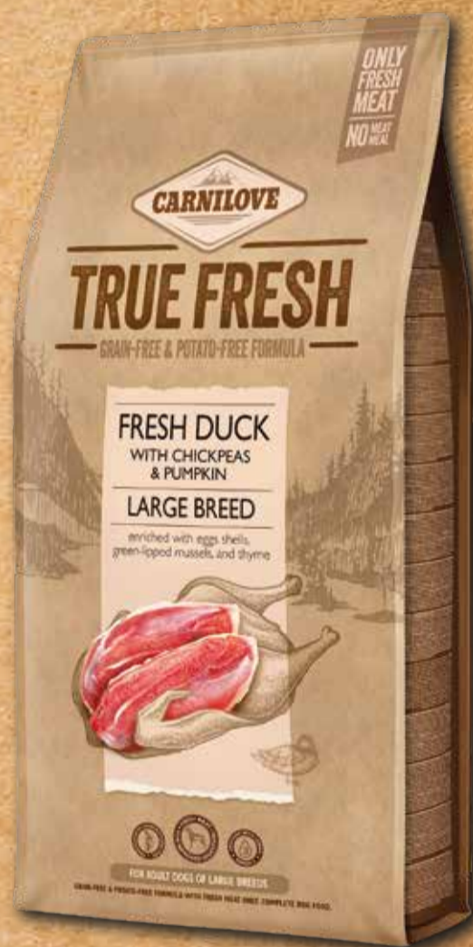
בוגר מגזע גדול ברווז טרי