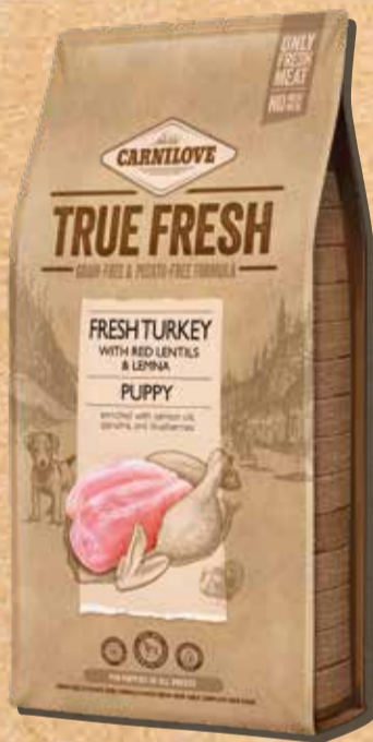
גור הודו טרי