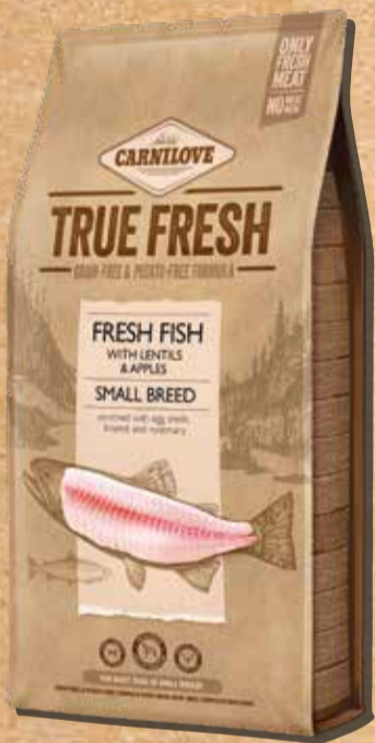
בוגר מגזע קטן דג טרי