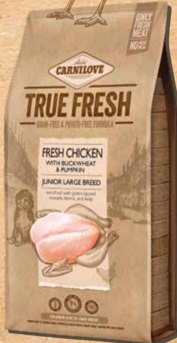
ג'וניור מגזע גדול עוף טרי